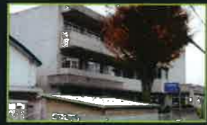
■川辺幼稚園、川辺小学校(約680m)